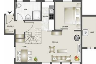
Grundriß vom Erdgeschoß