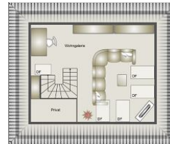
Grundriß vom Dachgeschoß