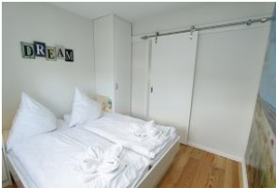
das Schlafzimmer - klein aber fein