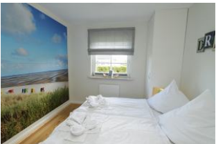
hier wachen Sie auf und schauen auf dieses beeindruckende Foto