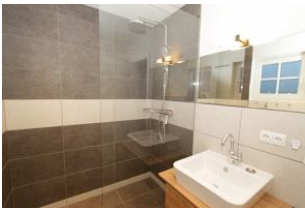
das moderne, sehr schön gestaltete Bad