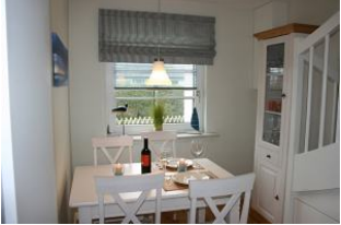
hier essen Sie zusammen mit Blick nach draußen