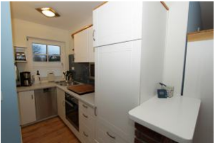
diese ist vollständig eingerichtet, da macht das Kochen Freude