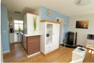
vom Wohnzimmer gelangen Sie direkt in die Küche