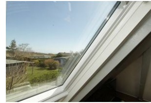
oder genießen den Ausblick auf die Umgebung