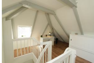
Sie könnten aber auch hier Ihre Urlaubspost erledigen