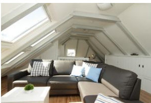
das Highlight - das zweite Wohnzimmer im Dachgeschoß mit großen Dachflächenfenstern, die viel Licht hereinlassen