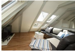
hier verbringen Sie gemütliche Fernsehabende