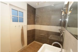
mit einer erfrischenden Dusche den Tag beginnen